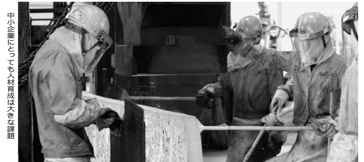
中小企業にとっても人材育成は大きな課題

日本の産業競争力の源泉である強いモノづくり。それは現場を担うモノづくり人材によって下支えされてきた。生産に直接に携わる技術者や熟練技能者だけではない。生産管理や品質、原価管理、設備保全から安全衛生に至る幅広い分野に関わるすべての人が力を発揮するとともに日々、現場革新に取り組むことで、世界最先端のモノづくりが実現されてきた。東日本大震災からの早期復旧をも可能にした「現場力」。その優位性をいまいちど、見つめ直す機運が高まっている。経営環境の変化に合わせ、現場力を再び鍛え上げ、日本の屋台骨を再構築する取り組みである。